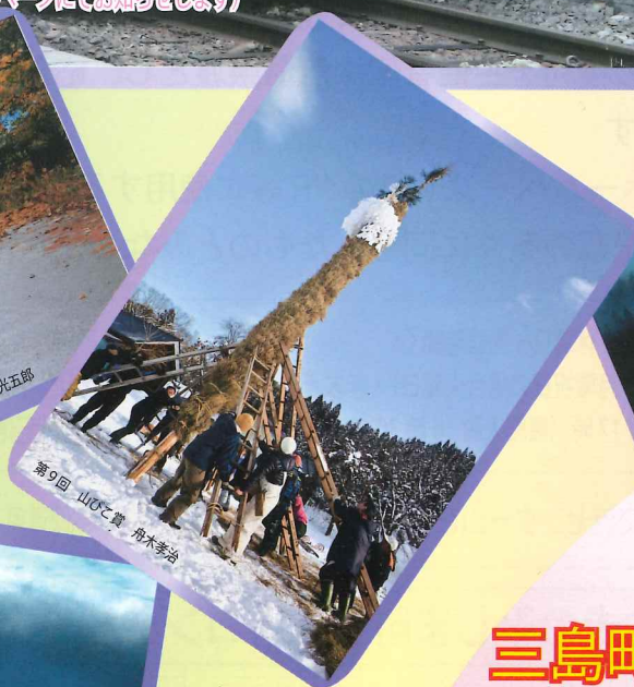
第9回 山の賞 舟木孝治