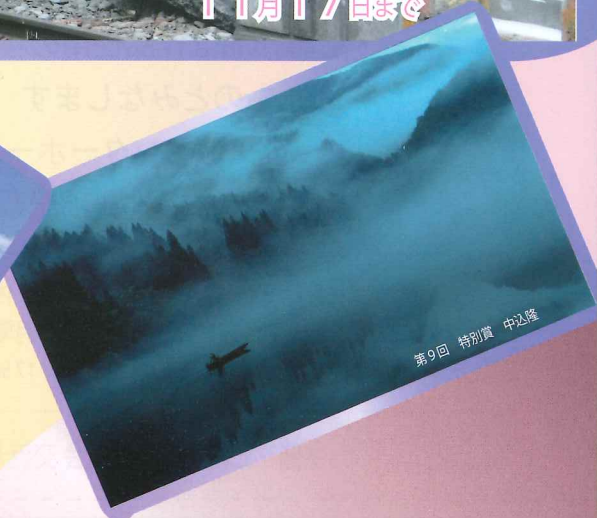
第9回 特別賞 中込隆